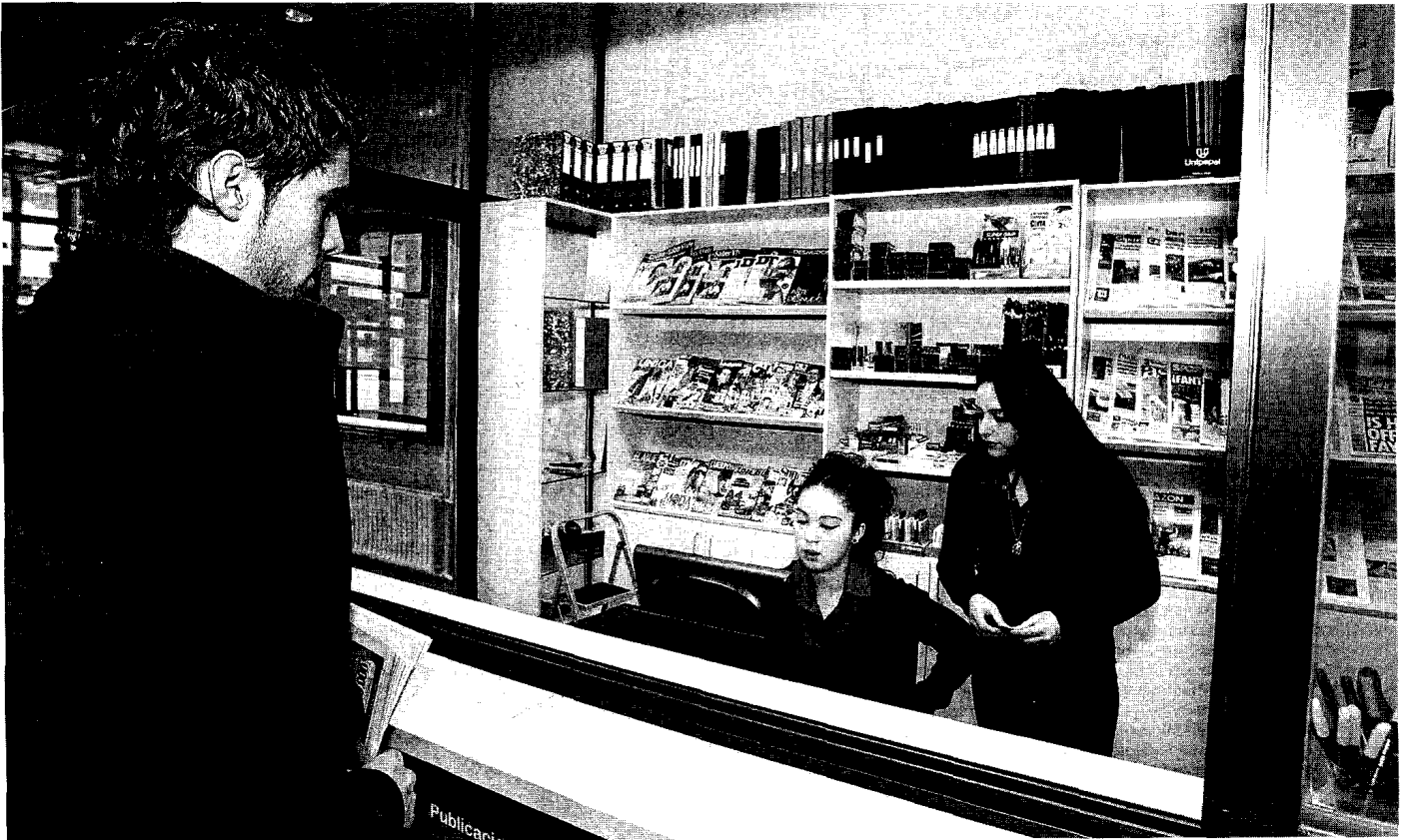
Un joven estudiante comprando en el Quiosco de Nabut, de prensa y material de papelería, gestionado por la Fundación Secretariado Gitano.

El desempleo se ceba en el eslabón más débil del mercado. Entidades sociales y centros de inserción sociolaboral demandan apoyo para una formación específica, empleo protegido y contratos desde la Administración a favor de los colectivos con dificultades. TEXTO Ana Ibarra