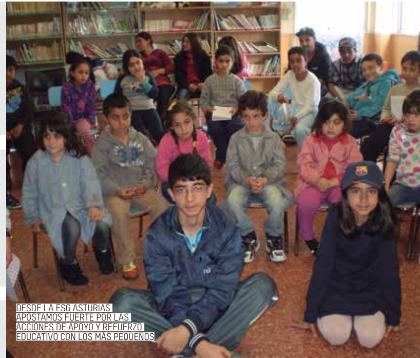
DESDE LA FSG ASTURIAS APOSTAMOS FUERTE POR LAS ACCIONES DE APOYO Y REFUERZO EDUCATIVO CON LOS MÁS PEQUEÑOS

INTERVENCIÓN EDUCATIVA.- Busca favorecer la normalización educativa del alumnado gitano en los barrios de Santa Marina de Piedramuelle, Casca y Ventanielles de Oviedo.