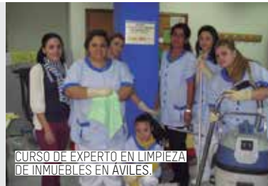
CURSO DE EXPERTO EN LIMPIEZA DE INMUEBLES EN AVILÉS.

A pesar de todo ello, como balance, podemos decir que la incorporación y la participación social de la comunidad gitana asturiana han avanzado durante los últimos años.