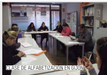
CLASE DE ALFABETIZACIÓN EN GIJÓN