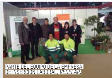
PARTE DEL EQUIPO DE LA EMPRESA DE INSERCIÓN LABORAL, VEDELAR.