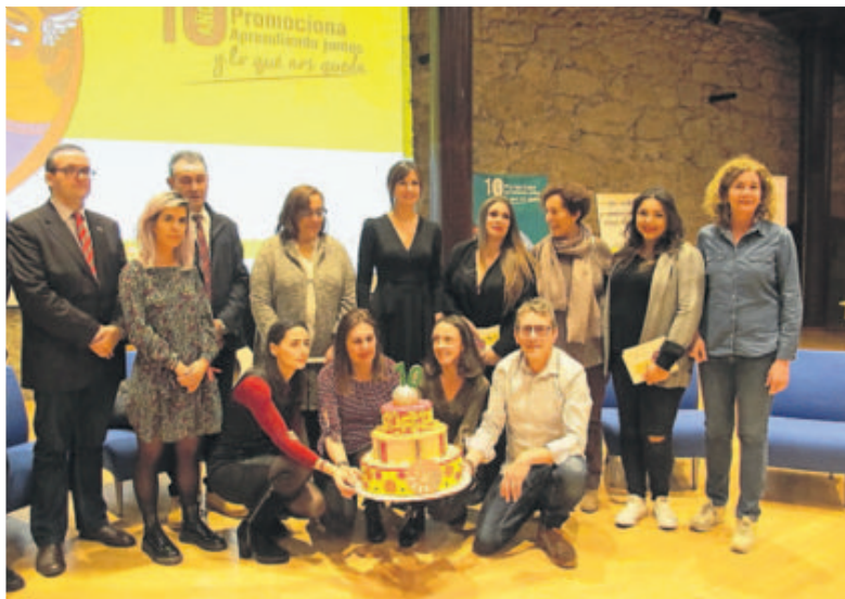
Celebración del 10.º cumpleaños del programa “Promociona”.