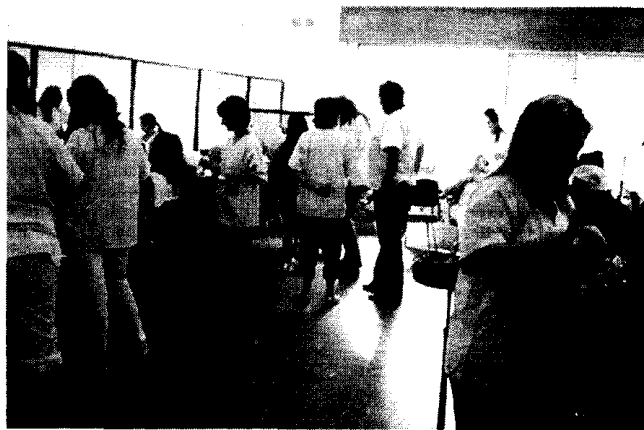
Una de las actividades que organiza la asociación de Mujeres Gitanas Romí.

La Asociación de Mujeres Gitanas Romí, cuya labor fue también reconocida con la Bandera de Andalucía, fue el germen del movimiento asociativo gitano feminista español, que ha cuajado en nuevas organizaciones y que en Andalucía cuenta con la Federación Andaluza de Mujeres Gitanas Fakali.