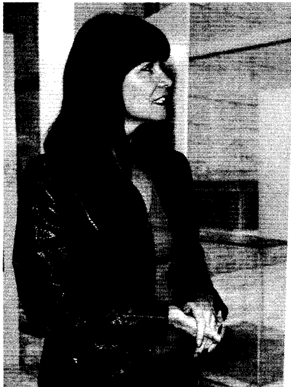
La titular de Igualdad y Bienestar Social, Micaela Navarro, durante la inauguración de las jornadas que se celebraron esta semana en Granada.

No ha sido éste el único acto organizado esta semana coincidiendo con el