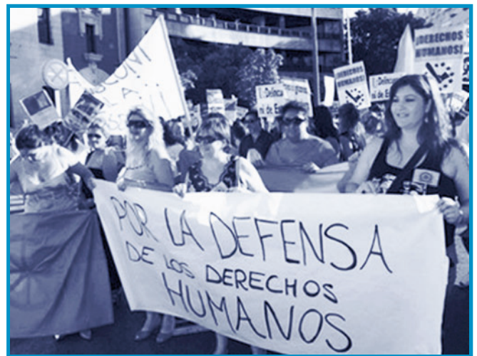
Manifestación de Madrid (7 agosto)

25 de octubre. Masiva manifestación en Italia contra las políticas de Berlusconi y las persecuciones hacia los gitanos e inmigrantes.