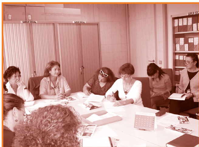
Reunión de la Mesa por la Igualdad

– Para alcanzar la meta de la Igualdad, es necesario dar respuesta a las necesidades más específicas de la mujer gitana en todos los ámbitos de participación, especialmente el empleo y la formación, desde una perspectiva cultural y de género que las sitúe en igualdad de oportunidades respecto a los hombres de su comunidad y las mujeres de la sociedad mayoritaria