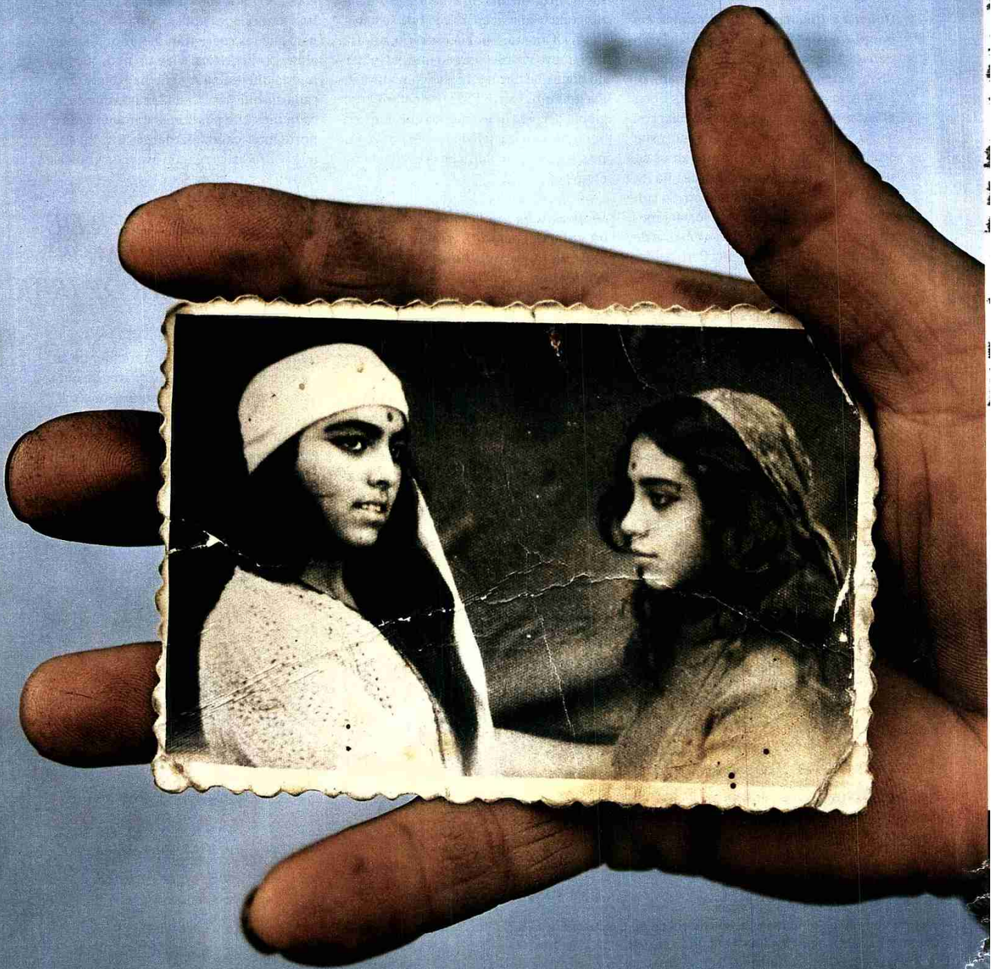
ESENCIA DE LA INDIA. Una mujer 'roma' de la región de Moldavia (Rumania) enseña la foto de dos parientes ataviadas con indumentarias indias.