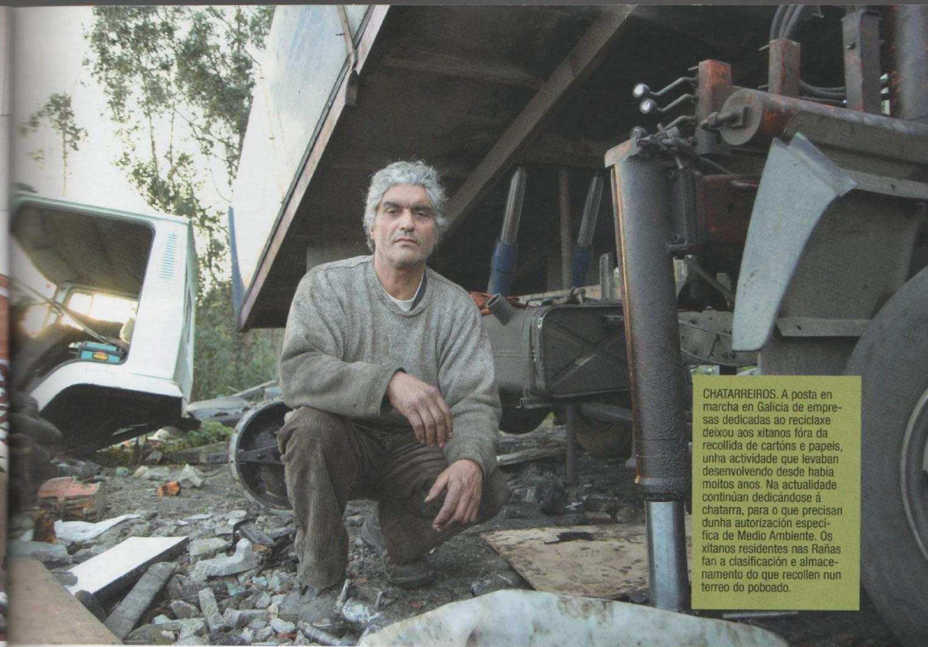
CHATARREIROS. A posta en marcha en Galicia de empresas dedicadas ao reciclaxe deixou aos xitanos fóra da recollida de cartóns e papeis, unha actividade que levaban desenvolvendo desde había moitos anos. Na actualidade continúan dedicándose á chatarra, para o que precisan dunha autorización específica de Medio Ambiente. Os xitanos residentes nas Rañas fan a clasificación e almacenamento do que recollen nun terreo do poboado.