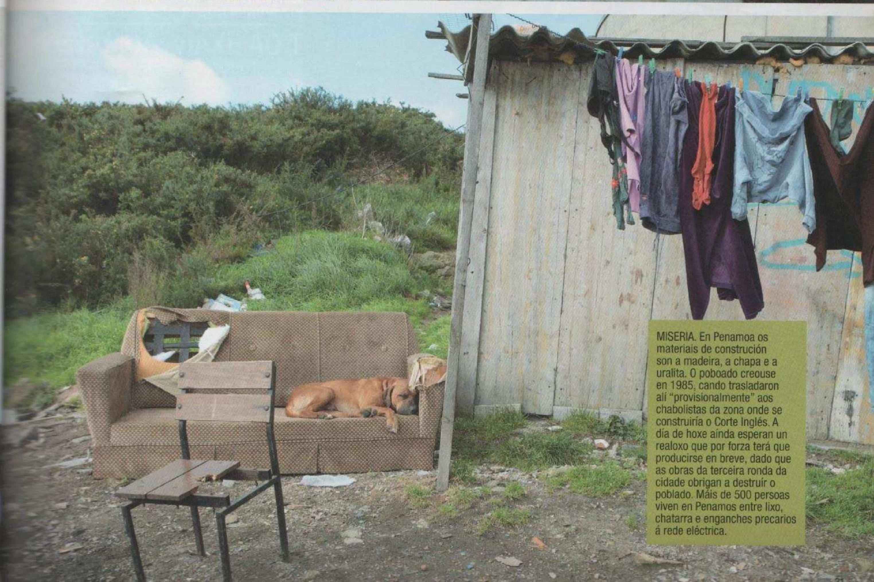
MISERIA. En Penamoa os materiais de construción son a madeira, a chapa e a uralita. O poboado creouse en 1985, cando trasladaron alí "provisionalmente" aos chabolistas da zona onde se construíría o Corte Inglés. A día de hoxe aínda esperan un realoxo que por forza terá que producirse en breve, dado que as obras da terceira ronda da cidade obrigan a destruír o poboado. Máis de 500 persoas viven en Penamos entre lixo, chatarra e enganches precarios á rede eléctrica.